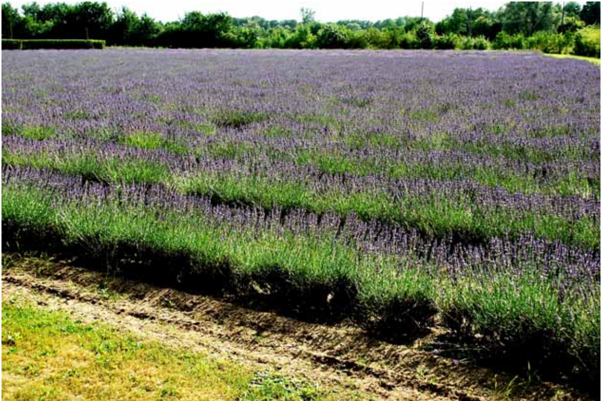
Den SE 59 (foto