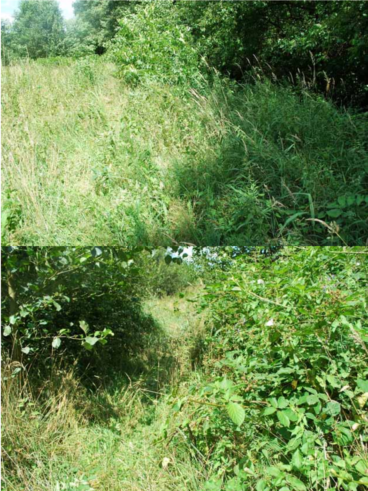
Onder de struiken op deze foto steekt men de Voortbeek over en volgt de Oever naar rechts toe