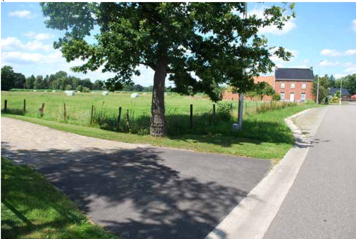
)die men volgt tot in de bocht naar rechts: men slaat linksin de Krollebosstraat in,(foto's