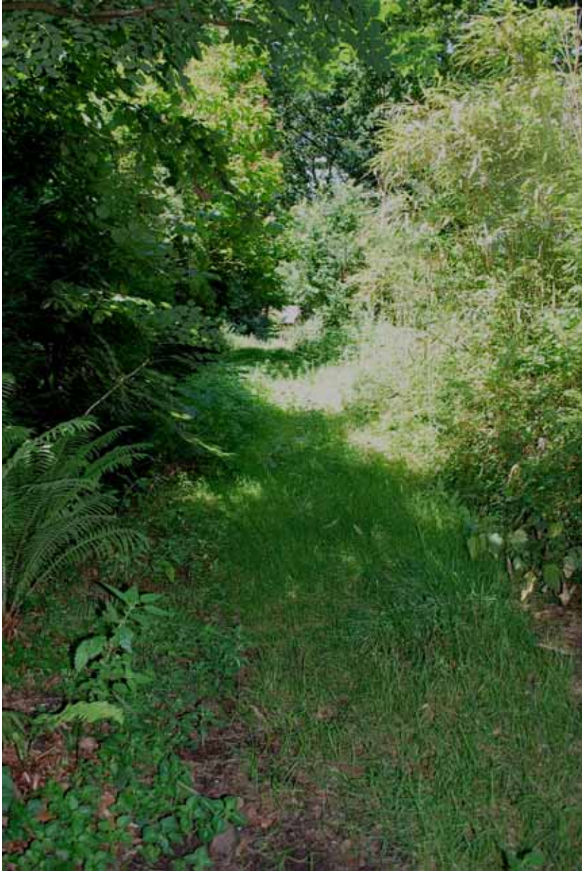
), waar CH 20 , over het erf van een onbewoond en wat vervallen boerdijtje,(foto