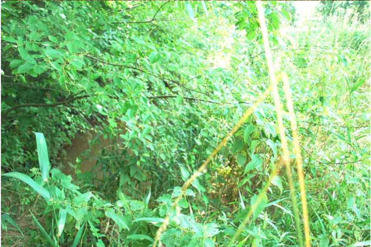
Onderaan links op deze foto de overwoekerde Voortbeek