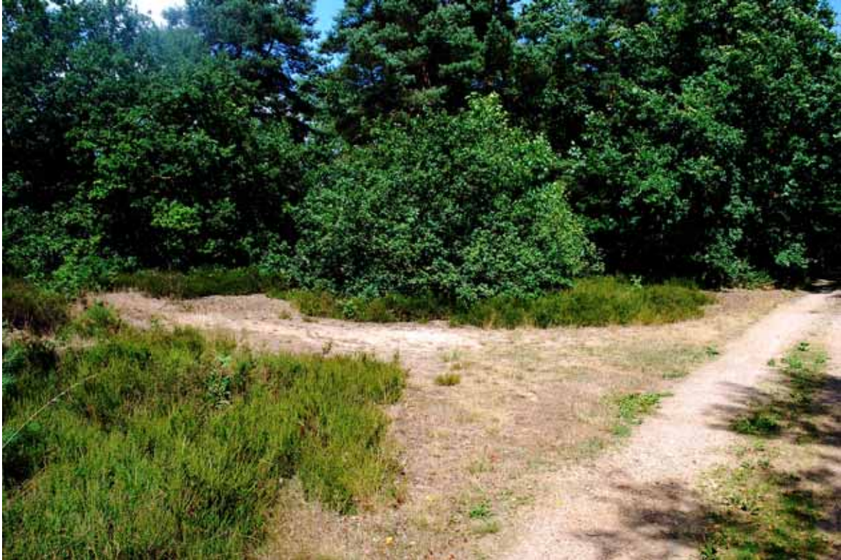
(natte beemd, ondergroei met veel bosbessen, hier en daar stukjes heide, vennetjes...