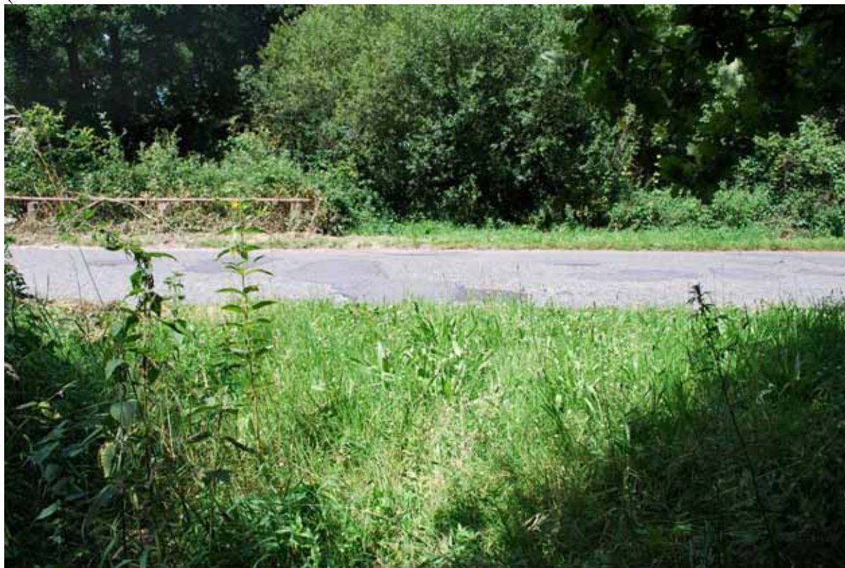
Men steekt de Zolderstraat (foto