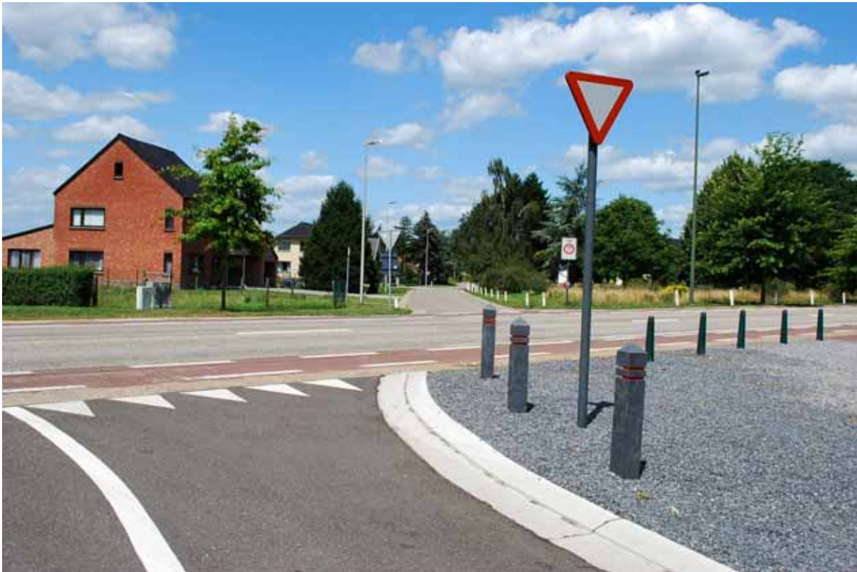
)- een gevaarlijk punt!- naar het kromme stukje Kanaalstraat, (foto